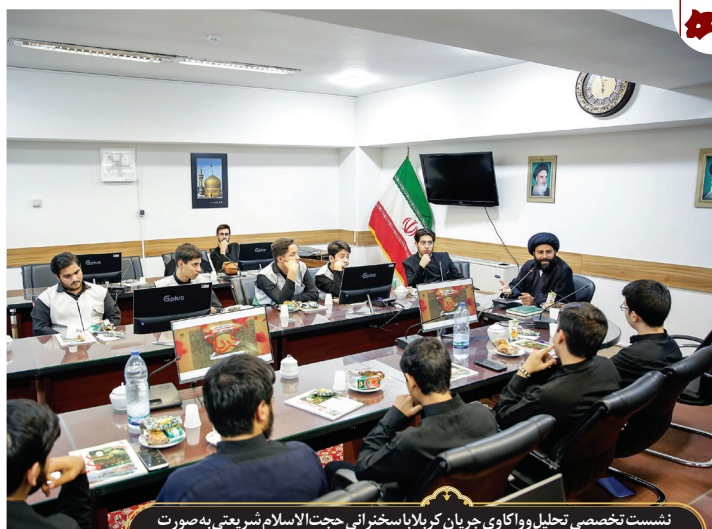
نشست تخصصی تحلیل و واکاوی جریان کربلا با سخنرانی حجت الاسلام شریعتی به صورت پرسش و پاسخ در جمع نوجوانان فعال فرهنگی، در حرم مطهر رضوی برگزار شد.