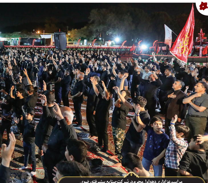
مراسم عزاداری دهه اول محرم در شرکت صنایع پیشرفته رضوی در محله جایتاز مشهد برگزار شد.

عاشقان اباعبدالله الحسین (ع) با حضور در آستان مبارک حضرت حسین ابن موسی الکاظم (ع) طیس، در اولین شب محرم عزاداری کردند.