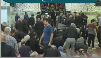
اجتماع زائران رضوی