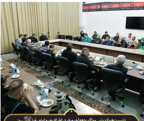
نشست هم‌اندیشی مواکب دهه آخر صفر در اطراف حرم امام رضا (علیه السلام)، روز چهارشنبه ۲۹ مرداد ۱۴۰۴ در اتاق جلسات معاونت خدمات زائران حرم مطهر رضوی برگزار شد