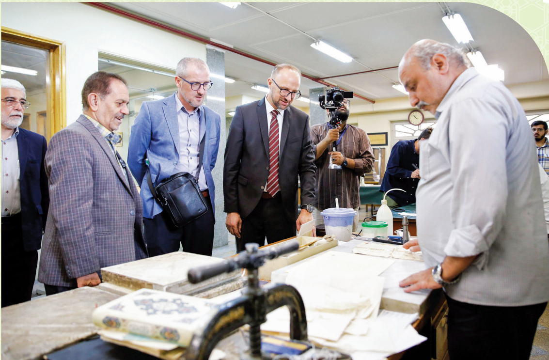
تقدیر رئیس کتابخانه «غازی خسرو بیگ» از کتابخانه رضوی